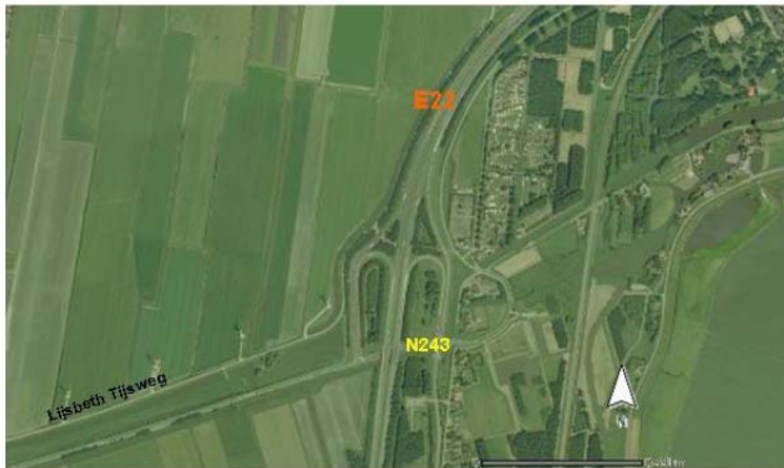
Figuur 6.2 Aansluiting N243 - A7

Een optimalisatie van het kruispunt is in het kader van de studie 'Ontwerp aansluiting industrieterrein Jaagweg op de N243' 27 onderzocht. Hieruit blijkt dat door het uit elkaar trekken van de conflicterende stromen er een goede verkeersafwikkeling op de aansluiting mogelijk wordt gemaakt ( I/C < 80\% ). De oplossing is alleen nog niet door alle partijen geaccordeerd.